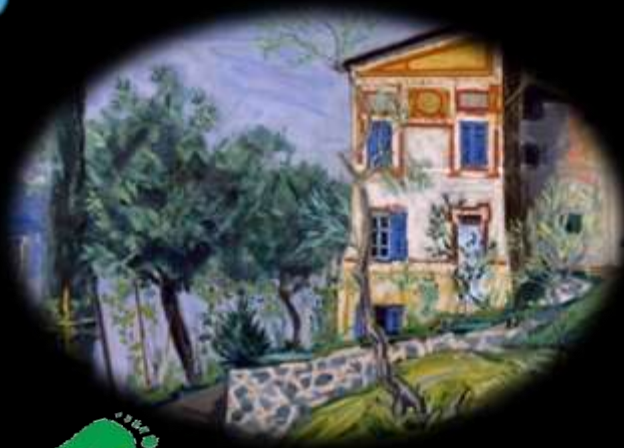
Carlo Zocchi, Il Bellotto a Lierna