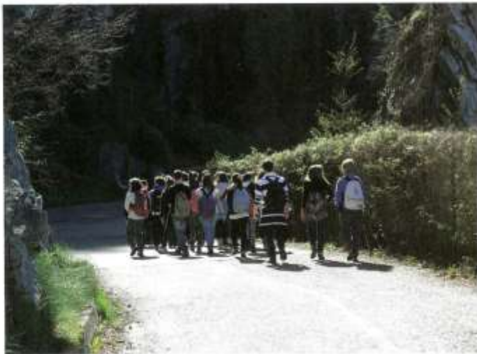
Students and teachers walking along "Sentiero del Viandante"

In fact, the more sensitive and attentive we become, the greater the satisfaction and pleasure we can get from experiencing our invaluable treasure.