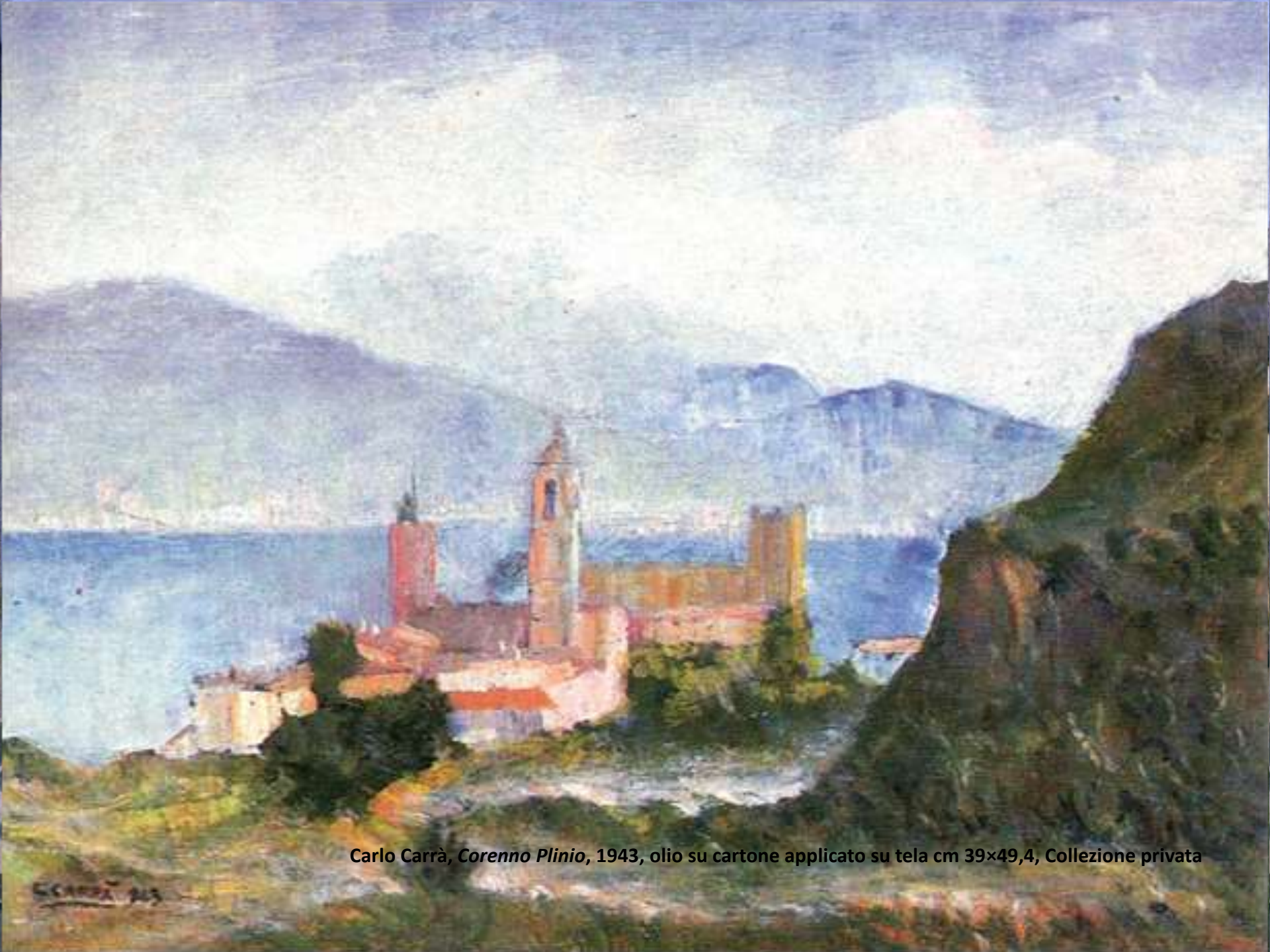
Carlo Carrà, Corenno Plinio , 1943, olio su cartone applicato su tela cm 39×49,4, Collezione privata