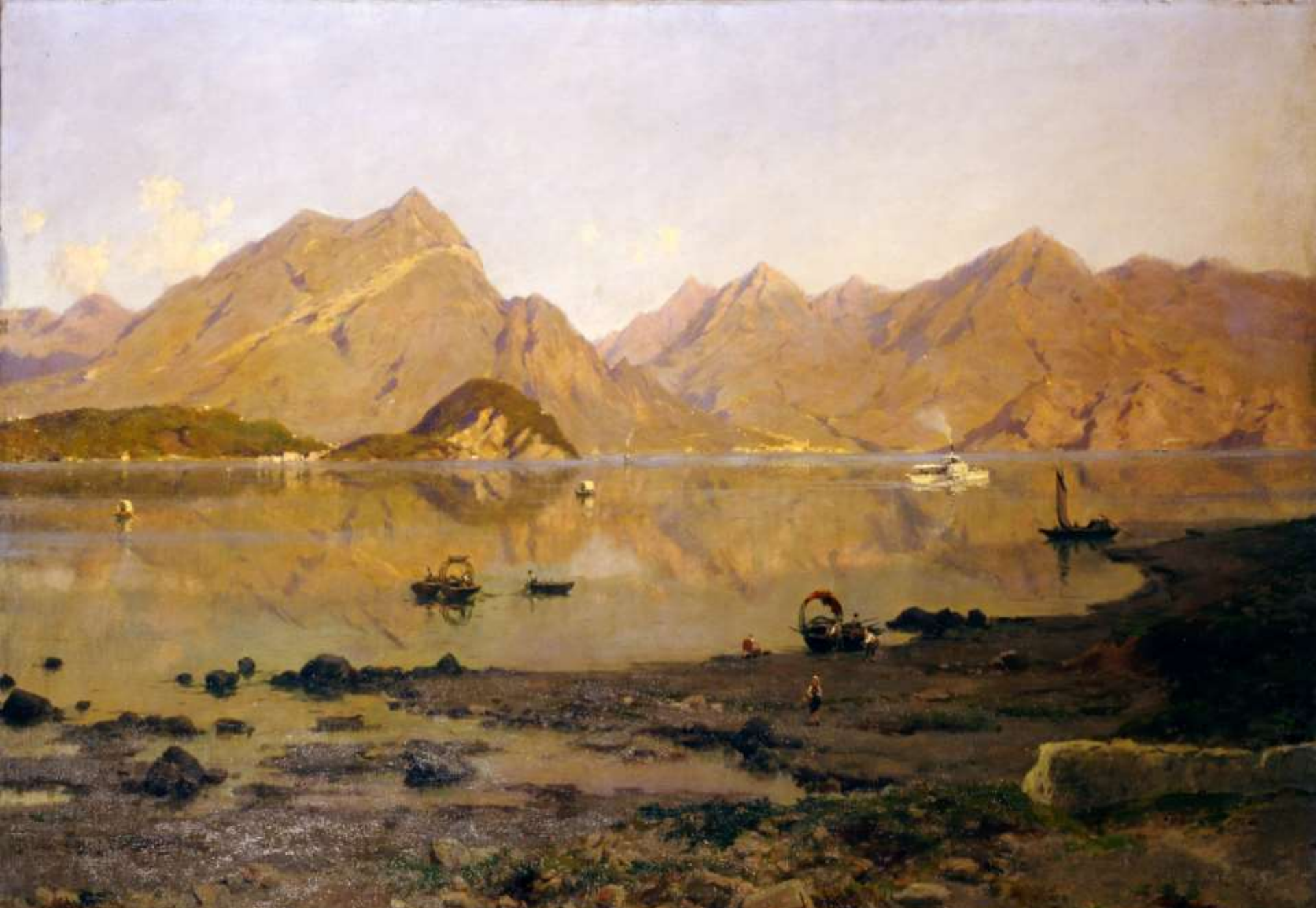
Silvio Poma, Veduta del lago di Lecco e la punta di Bellagio , 1888; olio su tela cm. 100,5 x 176,5, Milano, Gallerie d'Italia, Collezione Fondazione Cariplo