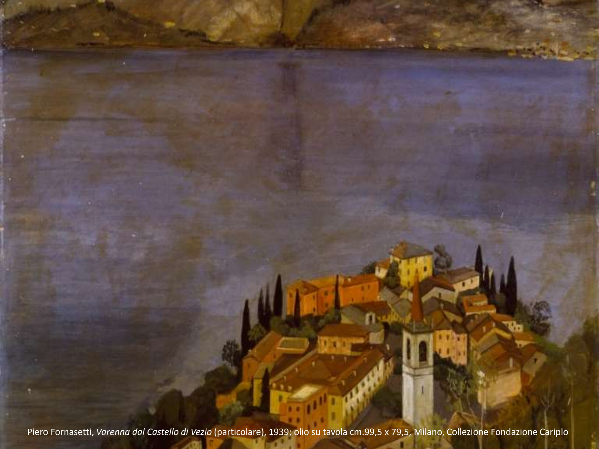
Piero Fornasetti, Varenna dal Castello di Vezio (particolare) , 1939; olio su tavola cm.99,5 x 79,5, Milano, Collezione Fondazione Cariplo