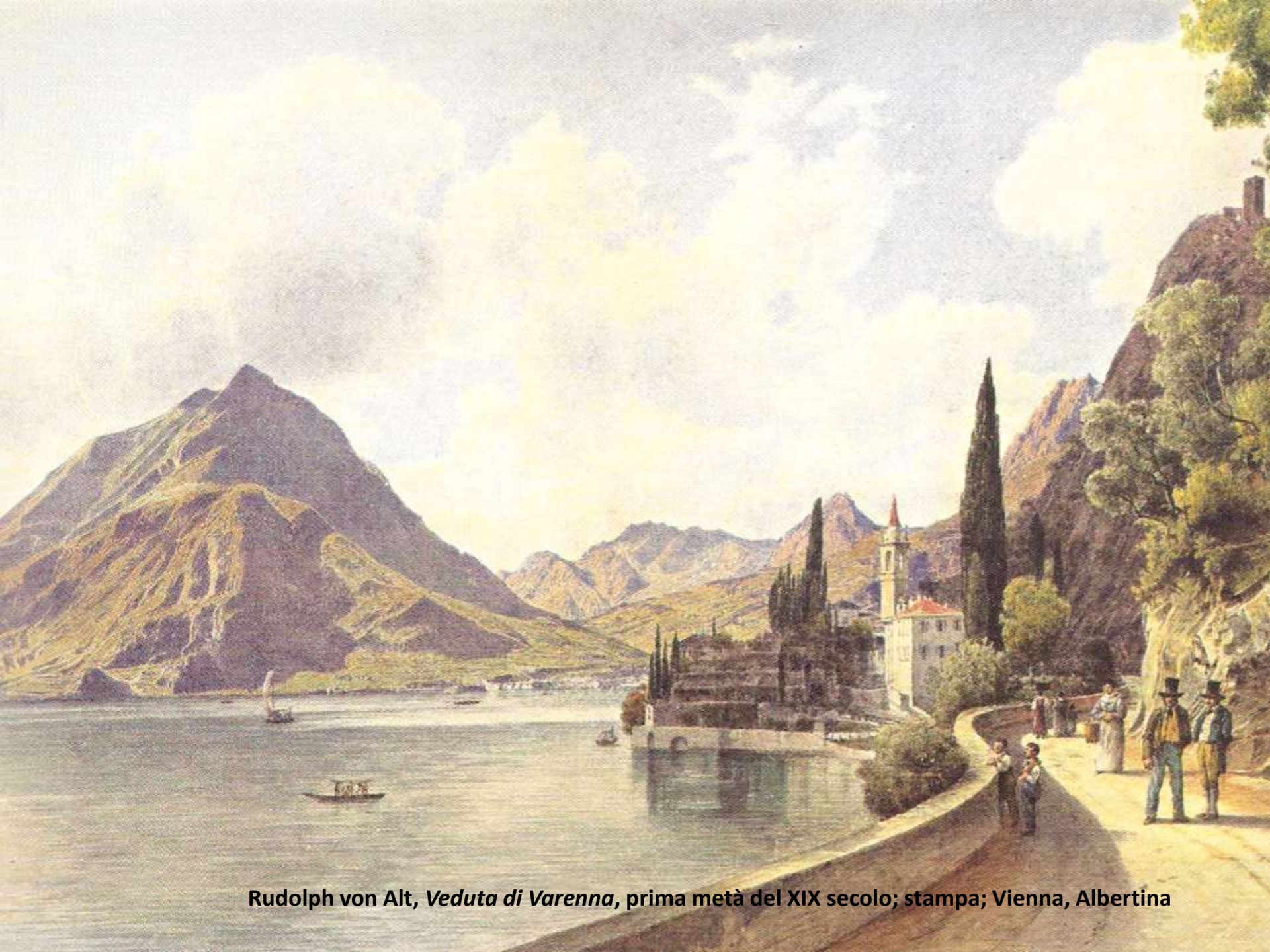
Rudolph von Alt, Veduta di Varenna , prima metà del XIX secolo; stampa; Vienna, Albertina