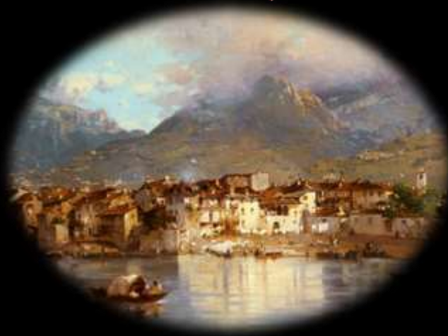
Gerolamo Induno, Pescarenico