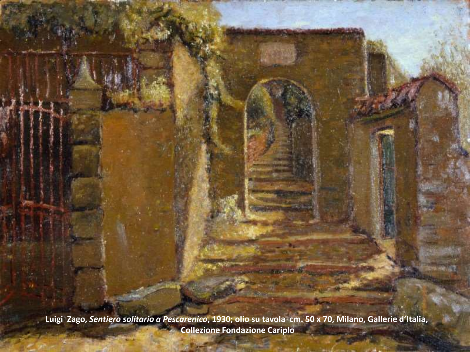
Luigi Zago, Sentiero solitario a Pescarenico , 1930; olio su tavola cm. 50 x 70, Milano, Gallerie d'Italia, Collezione Fondazione Cariplo