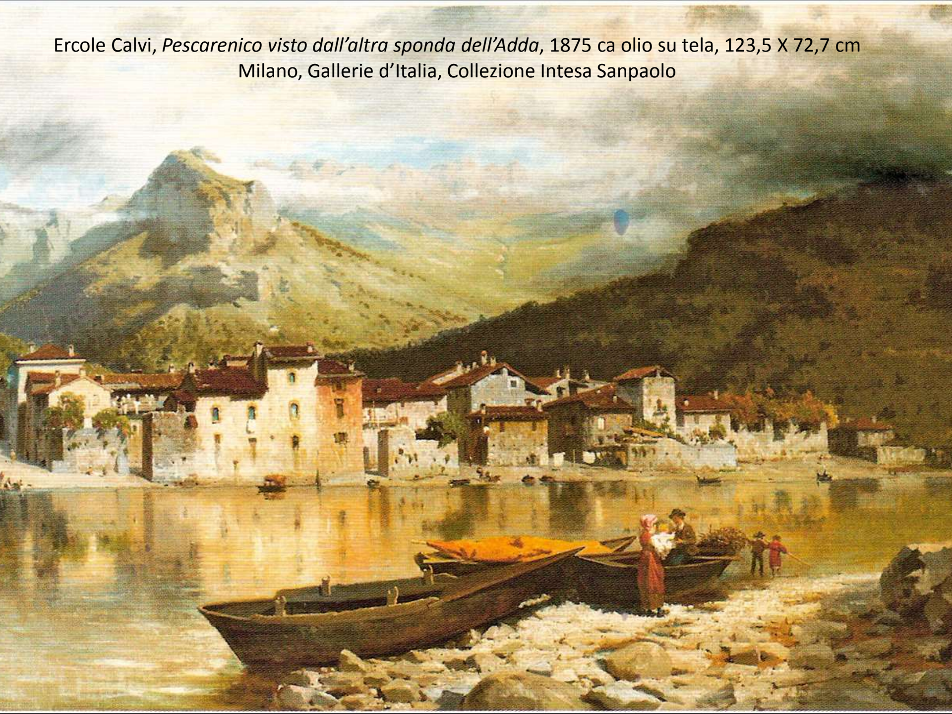
Ercole Calvi, Pescarenico visto dall'altra sponda dell'Adda , 1875 ca olio su tela, 123,5 X 72,7 cm Milano, Gallerie d'Italia, Collezione Intesa Sanpaolo