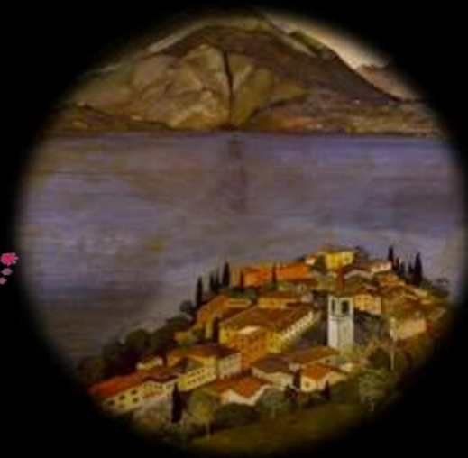
Piero Fornasetti, Varenna dal Castello di Vezio