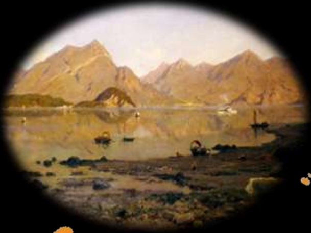
Silvio Poma, Veduta del lago di Lecco e la punta di Bellagio