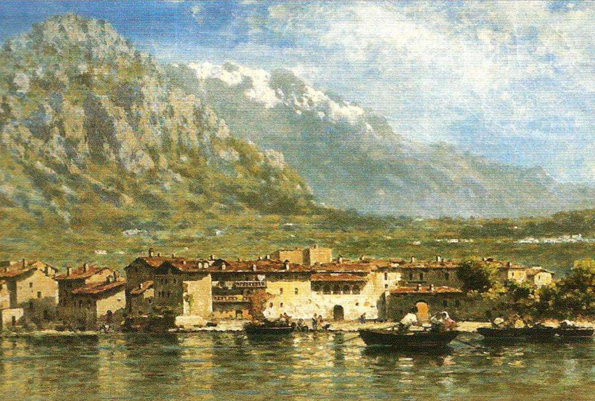
Federico Cortese, Pescarenico , 1890 Olio su tela, Milano, Gallerie d'Italia, Collezione Intesa Sanpaolo