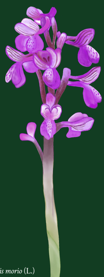
Anacamptis morio (L.)

Rigeneriamo, riutilizziamo, recuperiamo, ripariamo, manteniamo e tuteliamo i corsi d'acqua e i suoli