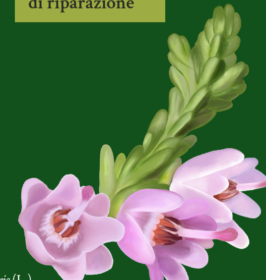
Calluna vulgaris (L.)

Sosteniamo gli obiettivi della Nature Restoration Law e promuoviamo la corresponsabilità delle scelte a vantaggio dell'ambiente e della comunità