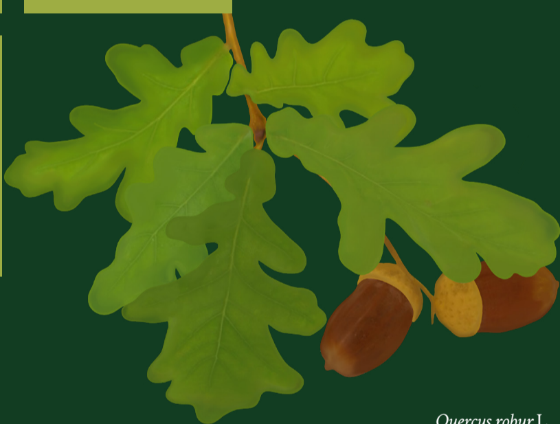
Quercus robur L.

Lavoriamo per una nuova sensibilità, anche estetica, per apprezzare la funzionalità della biodiversità e il capitale naturale