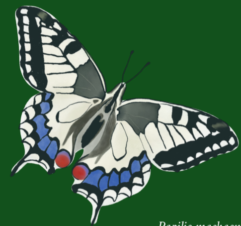
Papilio machaon L.

La biodiversità al centro del territorio: nuove opportunità e sinergie tra imprese, enti locali e terzo settore per la crescita sociale ed economica delle comunità